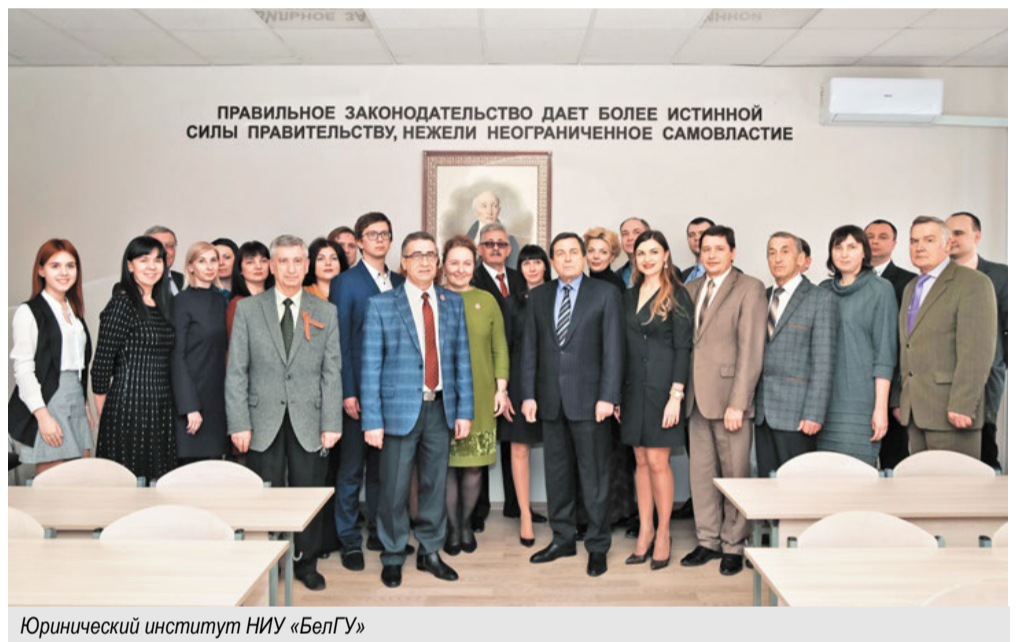
Юрический институт НИУ «БелГУ»