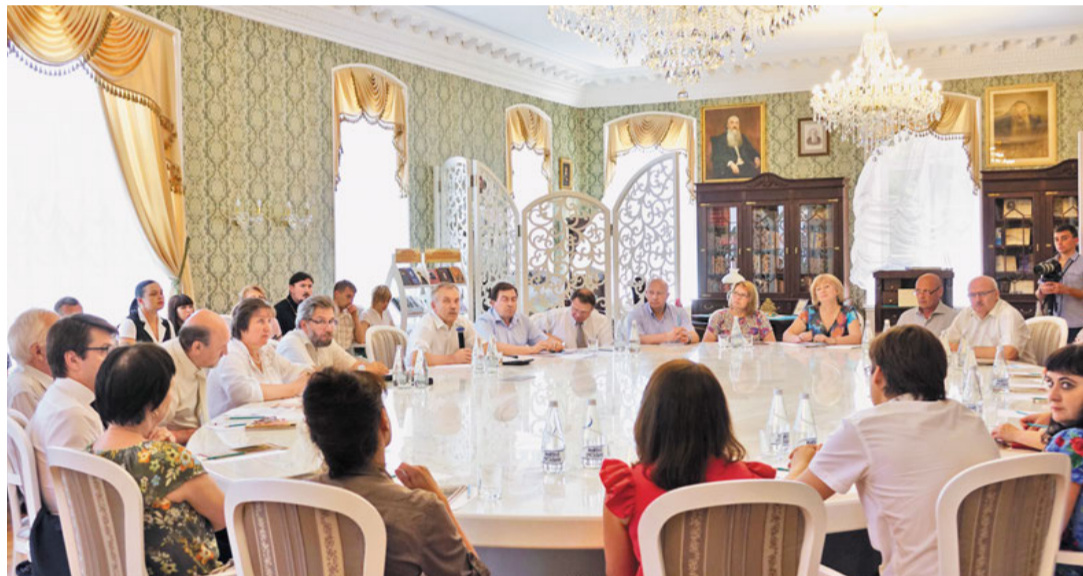
Открытие библиотеки-музея Н.Н. Страхова, 2017 год