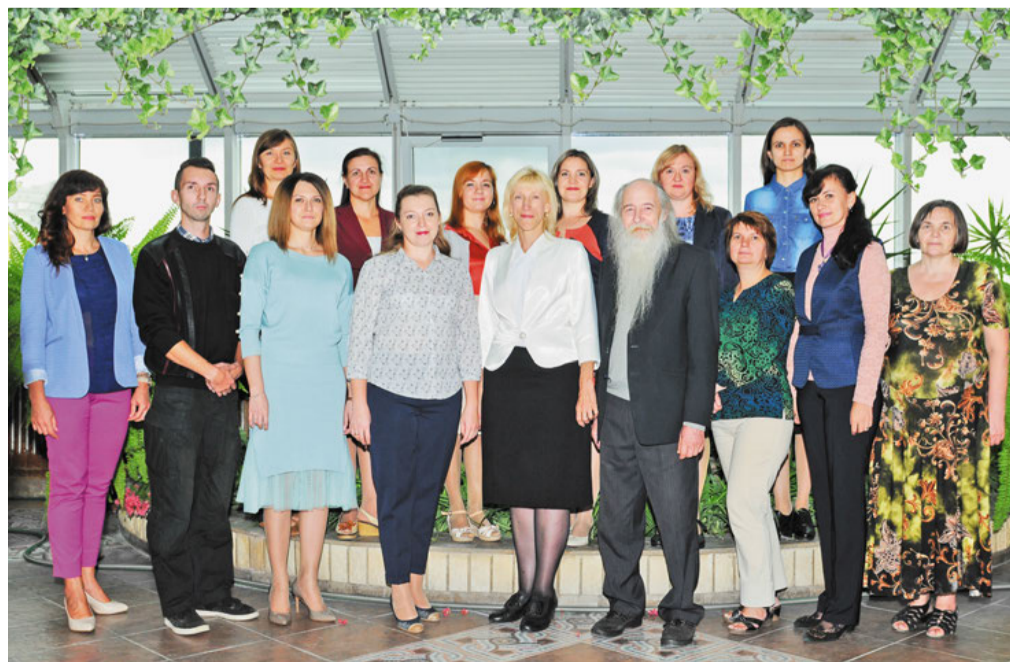
Кафедра биологии НИУ «БелГУ»