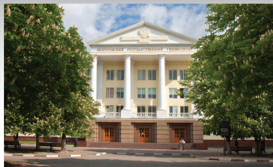
Учебный комплекс НИУ «БелГУ» по ул. Студенческой

Они работают в средних специальных учебных заведениях, гимназиях, лицеях города и области. Многие выпускники стали преподавателями высших учебных заведений. В рамках