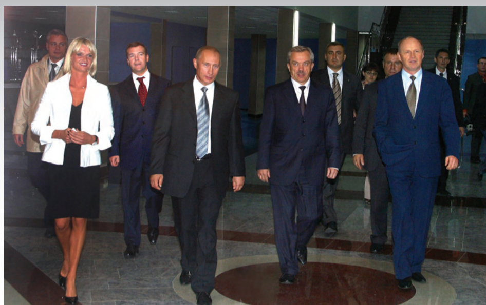
Почётные гости НИУ «БелГУ»

Студенты защищают честь Белгородчины на международных и всероссийских соревнованиях: Олимпийских играх, чемпионатах и первенствах мира и Европы, чемпионатах России и т.д. Для повышения качества подготовки специалистов постоянно улучшается материально-техническая база факультета. В марте 2007 года введён в эксплуатацию Учебно-спортивный комплекс БелГУ С. Хоркиной, который включает в себя несколько объектов: бассейн – восемь 50-метровых дорожек, вышки и трамплины для прыжков в воду, специ-