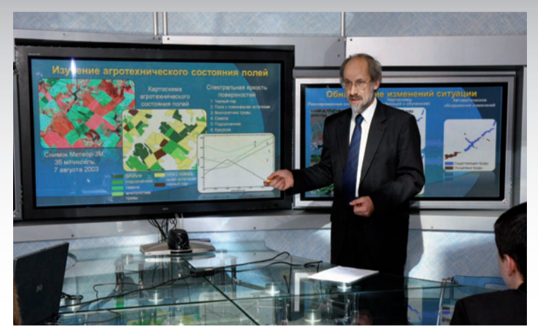
В обучении используется самое современное оборудование

ких островах, в Санкт-Петербурге и живописных местах Белгородской области и окрестностях г. Белгорода (на базе отдыха БелГУ на реке Нежеголь, Центрально-Чернозёмный заповедник «Лес на Ворскле» и др.). На старших курсах студенты проходят учебно-производственную и педагогическую практику в научно-исследовательских учреждениях, государственных и коммерческих структурах, школах города и области.