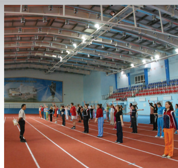
Занятия в Учебно-спортивном комплексе Светланы Хоркиной

шахматный клуб, медицинский восстановительный центр. В целом, факультет располагает одной из лучших в России материально-технической базой, здесь созданы все условия для формирования творческой личности.