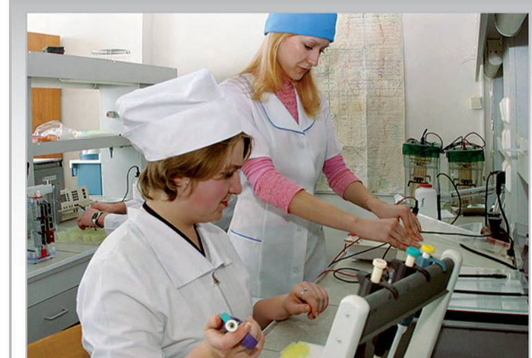
Медицинский факультет: в интерьере лаборатории

Специальность 060105 «Стоматология». Квалификация выпускника – врач-стоматолог. Продолжительность обучения 5 лет. Форма обуче-