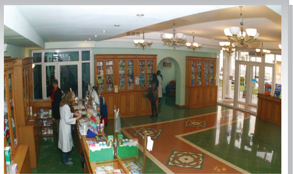
Аптека БелГУ – прекрасная учебно-производственная база для студентов-фармацевтов

В настоящее время обучение ведётся на дневном и заочном отделениях на бюджетной и договорной основах. Осуществляется приём иностранных студентов.