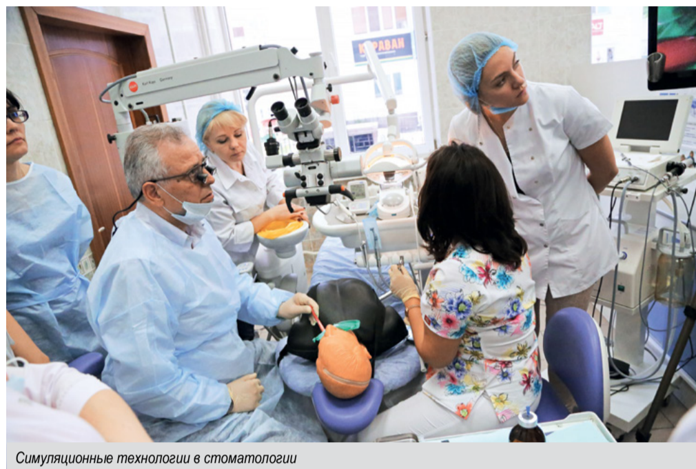
Симуляционные технологии в стоматологии