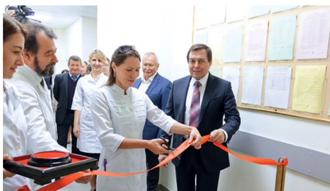
Открытие НИИ Фармакологии живых систем