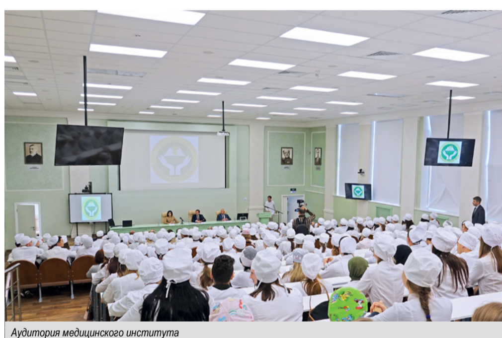
Аудитория медицинского института

В институте функционируют диссертационные советы по научным специальностям: «Генетика»; «Фармакология, клиническая фармакология»; «Хирургия»; «Акушерство