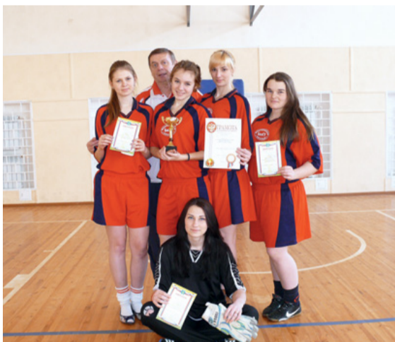
Вolleyбольная команда медицинского колледжа