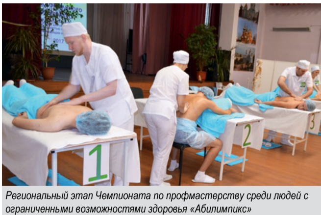
Региональный этап Чемпионата по профмастерству среди людей с ограниченными возможностями здоровья «Абилимпикс»