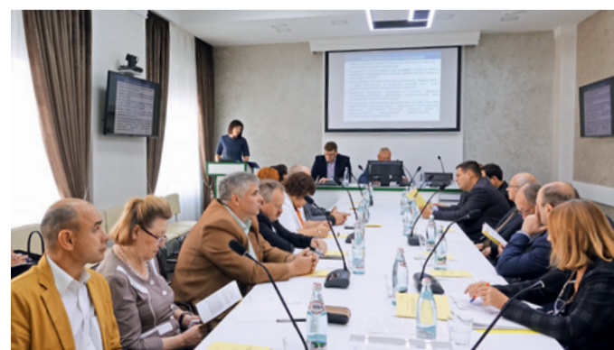
Заседание диссертационного совета медицинского института НИУ «БелГУ»