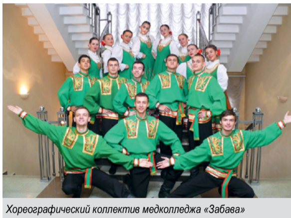
Хореографический коллектив медколледжа «Забава»