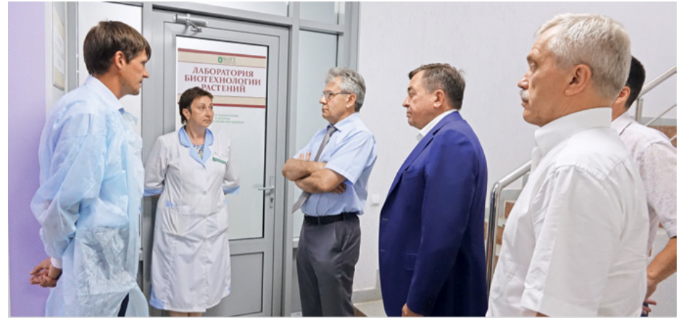
Президент РАН Александр Сергеев, губернатор Евгений Савченко и ректор НИУ «БелГУ» Олег Полухин в НОЦ «Ботанический сад НИУ «БелГУ»

Отметив, что с НОЦ уже активно взаимодействуют различные структуры Российской