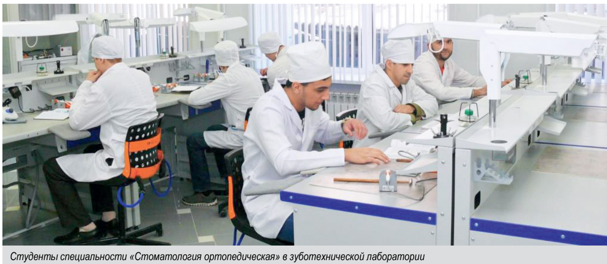
Студенты специальности «Стоматология ортопедическая» в зуботехнической лаборатории