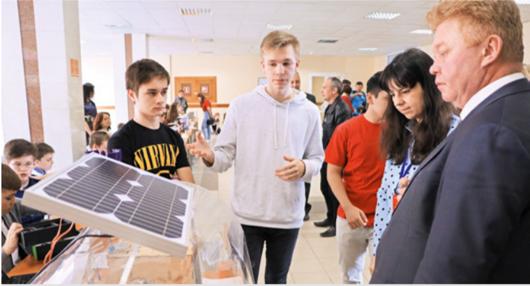
На фестивале детско-юношеского научно-технического творчества «Робостарт»

Современная инновационная экономика требует подготовки технических специалистов нового уровня, способных полноценно владеть фундаментальными знаниями, проектными умениями, интегрировать, обрабатывать информацию из различных источников и областей, ну и, конечно, обладать лидерскими качествами, навыками работы в команде. Программа элитной подготовки таких специалистов реализуется в институте инженерных и цифровых технологий (ИИИЦТ) Белгородского государственного университета.