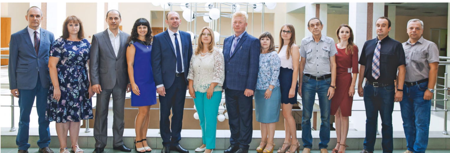
Коллектив института – победитель конкурса профессионального мастерства НИУ «БелГУ» по научно-исследовательской работе