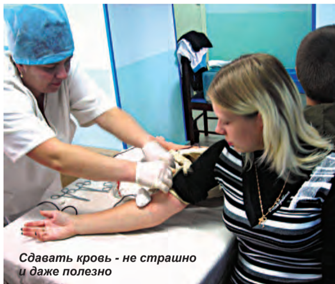
Сдавать кровь - не страшно и даже полезно

Некоторые с опаской спрашивали врачей о возможности заражения различными заболеваниями. А те, улыбаясь, показывали индивидуально упакованные стерильные наборы и рассказывали о пользе сдачи крови для самого донора, чтобы клетки организма быстрее обновлялись. Недаром же раньше для оз-