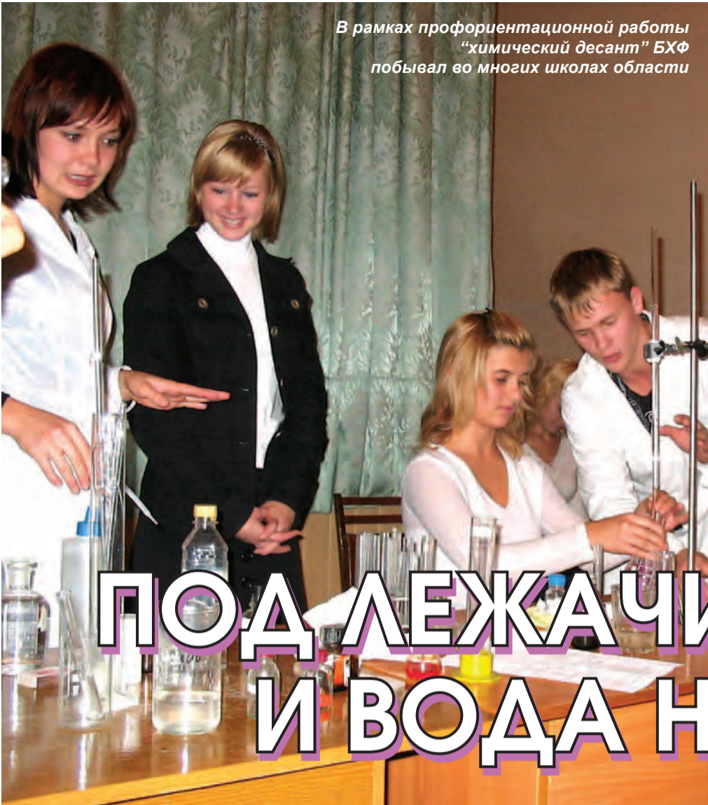
В рамках профориентационной работы "химический десант" БХФ побывал во многих школах области

Каким будет день завтрашний для Белгородского государственного университета? Будущее зависит от нас самих. От того, сколько абитуриентов поступит в БелГУ следующим летом. От того, как будут работать студенты и преподаватели, ответственные за профориентационную работу вуза. «Будни» попросили представителей факультетов поделиться опытом привлечения абитуриентов.