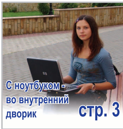
С ноутбуком - во внутренний дворик стр. 3