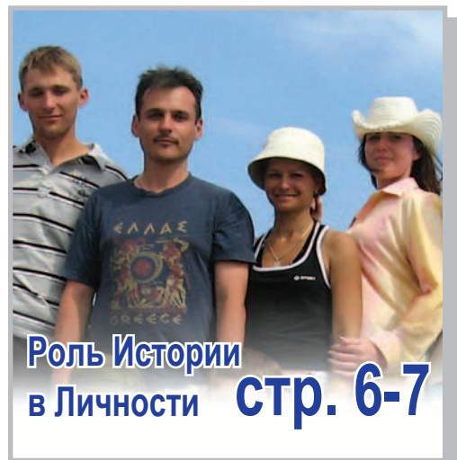
Роль Истории в Личности стр. 6-7