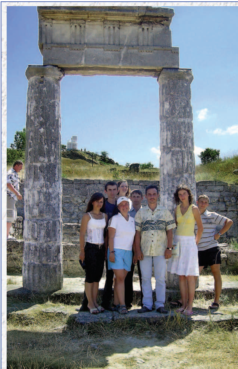
У стены Аккермановской крепости (близ Одессы, Белгород-Днестровский)

Пусть новые поколения найдут в нашей науке то, что в свое время нашли в ней мы — свободу, радость научного поиска, любовь к ближнему, роскошь человеческого общения.