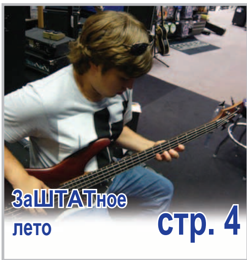
ЗаШТАТное лето стр. 4