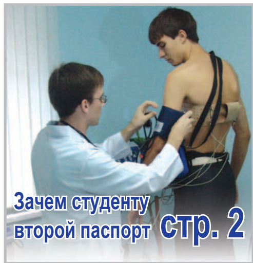
Зачем студенту второй паспорт стр. 2