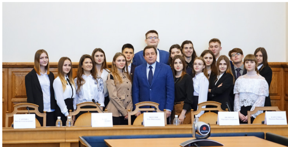
Ежегодная ректорская образовательная деловая игра – традиция института

В рамках практико-ориентированного обучения в институте открываются тематические аудитории, которые позволяют студентам более глубоко погрузиться в профессиональную среду и проводить профориентационные мероприятия для школьников. В институте открыты семь уникальных образовательных пространств, в том числе аудитория Федеральной налоговой службы России по Белгородской области, аудитория Сбербанка – «Учебный банк», консалтинговый центр «УНИФ», «HR-лаборатория», аудитория «TourOffice» и другие.