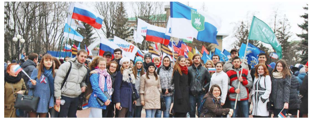
Участники областного митинга, посвящённого Дню народного единства