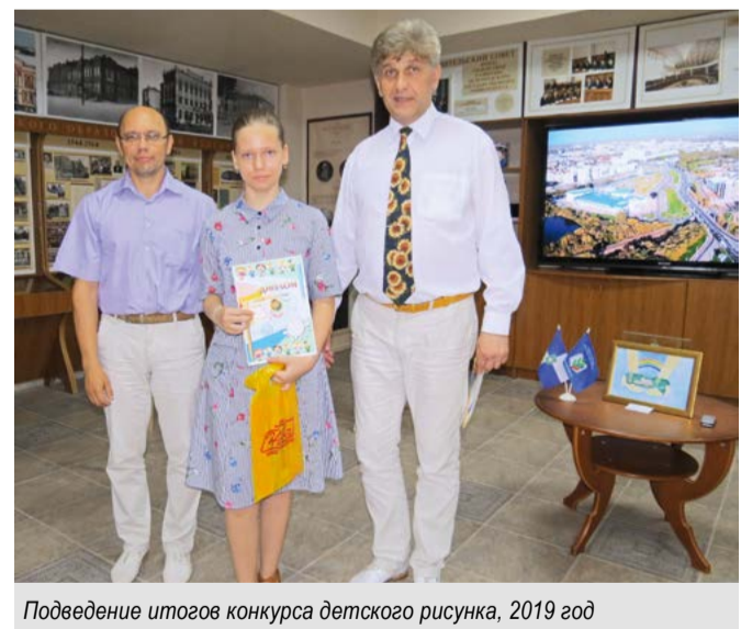
Подведение итогов конкурса детского рисунка, 2019 год

Беседовала Светлана НЕПОМНЯЦАЯ P.S. Полный текст читайте на Студенческом портале http://stud.bsu.edu.ru