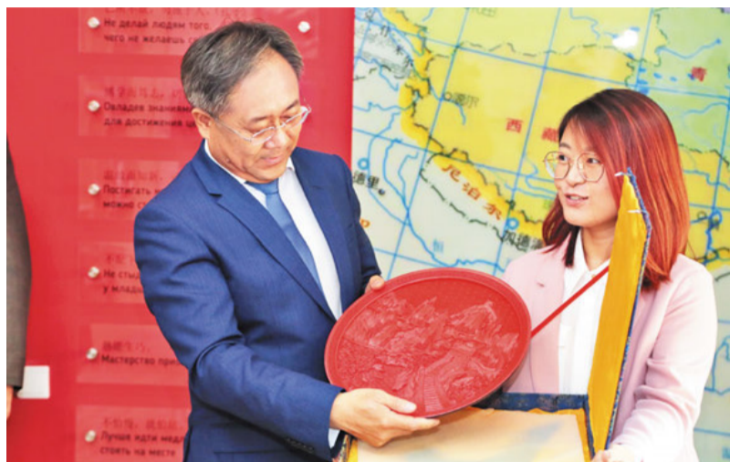
В НИУ «БелГУ» открыт Центр китайского языка и культуры.