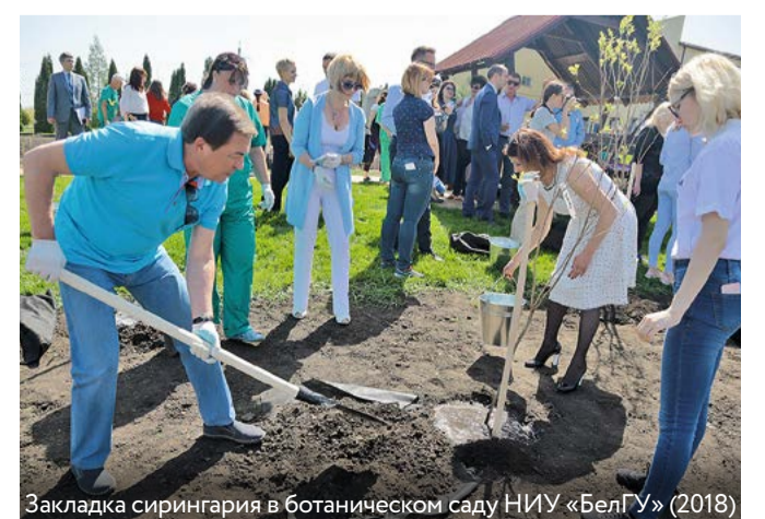
Закладка сирингария в ботаническом саду НИУ «БелГУ» (2018)