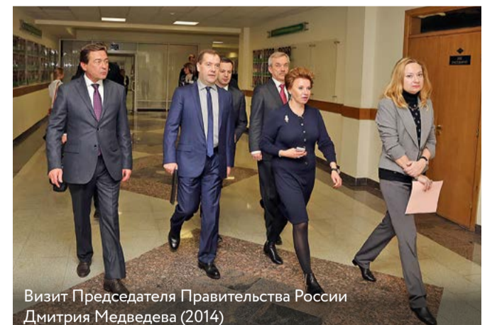
Визит Председателя Правительства России Дмитрия Медведева (2014)