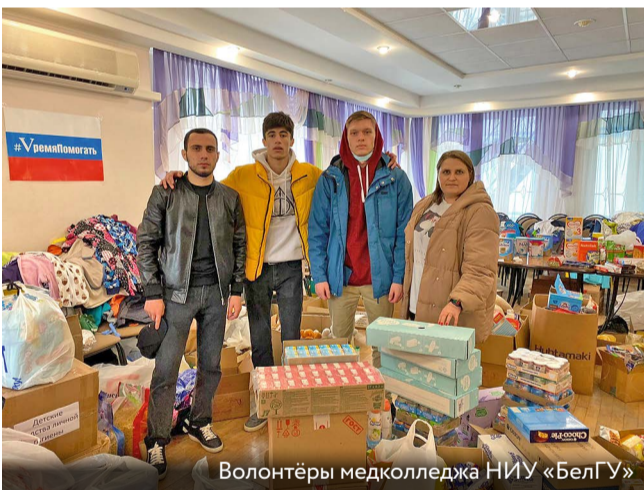
Волонтеры медколледжа НИУ «БелГУ»

Когда на долю русского народа выпадали тяжёлые испытания, то он становился сильнее в единстве и вере в Победу. Вот и сейчас добровольцы – студенты, преподаватели и сотрудники НИУ «БелГУ» – в рамках федерального проекта #МыВместе делают всё, чтобы помочь беженцам из Украины, ДНР и ЛНР, а также поддержать российских солдат, выполняющих свой долг на Донбассе.