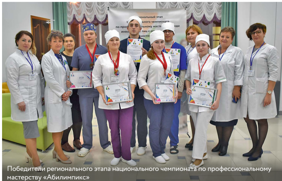
Победители регионального этапа национального чемпионата по профессиональному мастерству «Абилимпикс»

В 1935 году техникум был реорганизован в фельдшерско-акушерскую школу с приёмом на специальность фельдшера 270-ти, а акушерок – 70-ти человек. С началом Великой Отечественной войны потребность в среднем медицинском персонале резко возросла, поэтому обучение на 2 и 3 курсах началось раньше срока и проводилось по ускоренной программе. Досрочный выпуск был мобилизован в армию, многие преподаватели школы, прервав работу, добровольно пошли служить, а некоторые работали в госпиталях. Сотрудники и учащиеся школы вписали памятные и славные страницы в историю своей Родины, проявляя героизм с самого начала войны, на фронте и во время оккупации Белгорода.