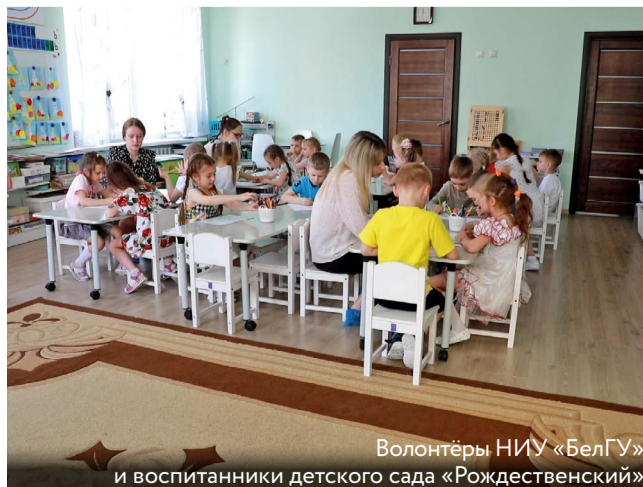
Волонтеры НИУ «БелГУ» и воспитанники детского сада «Рождественский»