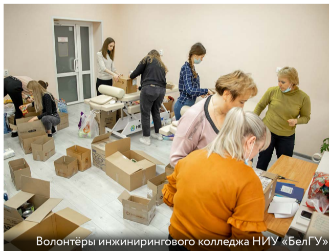
Волонтеры инженерингового колледжа НИУ «БелГУ»

Созданный на площадке НИУ «БелГУ» Центр волонтерского движения «ДоброТворец» консолидирует усилия всех неравнодушных.