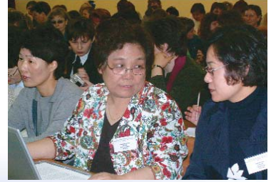
Ученые всего мира собрались в БелГУ

по развитию идеи М. Монтессори о "космическом воспитании". По завершении конгресса руководство вуза предложило ведущим иностранным специалистам включиться в работу БелГУ по подготовке Монтессори-педагогов. Конгресс подтвердил востребованность педагогики М. Монтессори и факт ее широкого распространения в России.