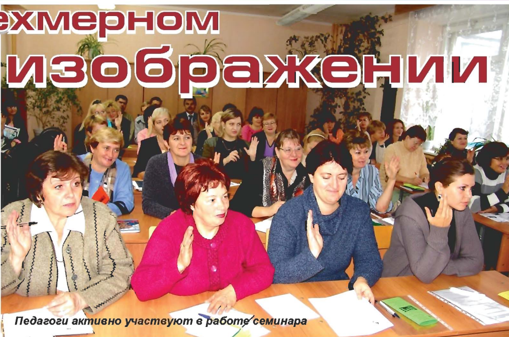
Педагоги активно участвуют в работе семинара

«Это будет очень интересно детям, увлечёт их, положительно отразится на успеваемости и на