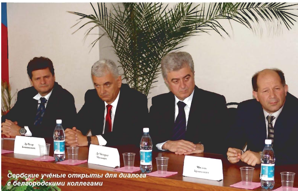
Сербские учёные открыты для диалога с белгородскими коллегами