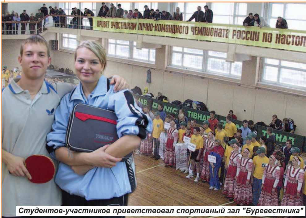
Студентов-участников приветствовал спортивный зал "Буревестника"