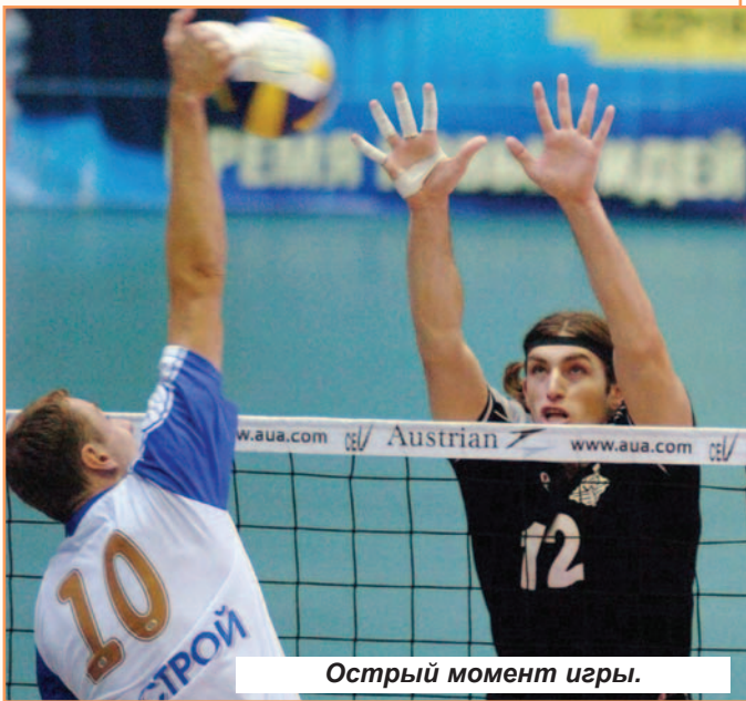
Острый момент игры.

- Какие теперь, имея "в кармане" бронзу Олимпиады,