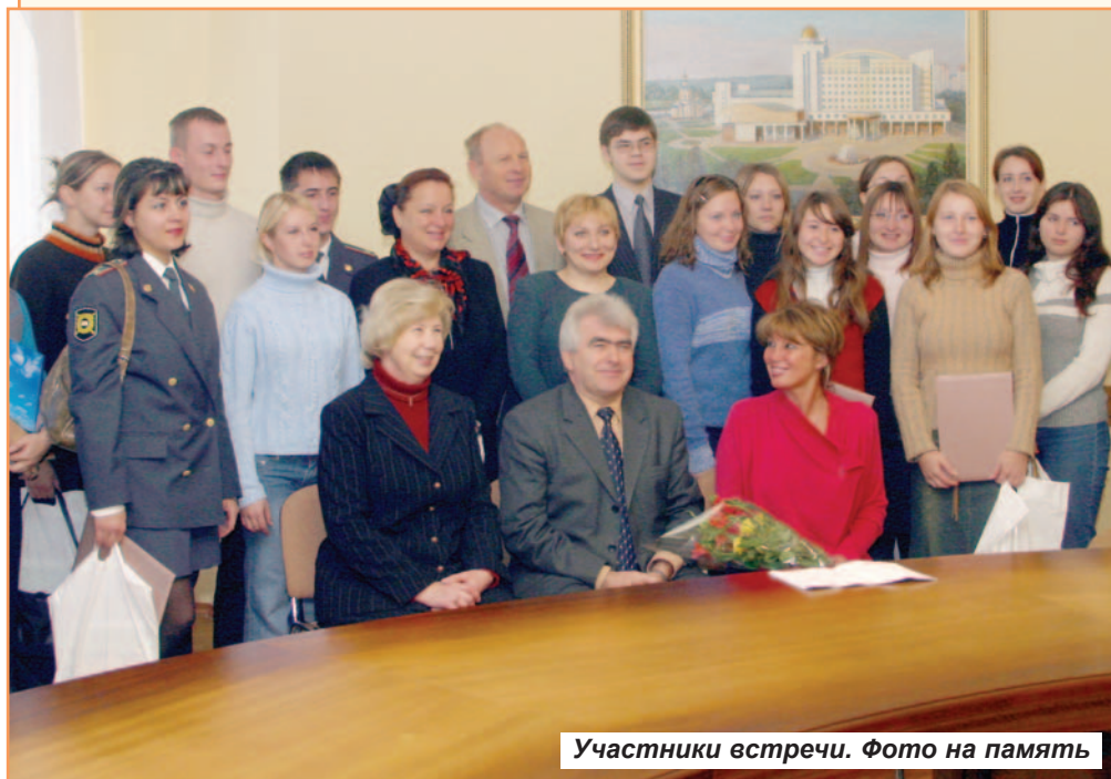
Участники встречи. Фото на память