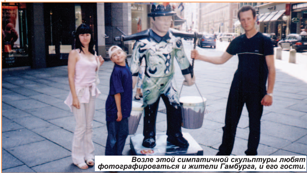
Возле этой симпатичной скульптуры любят фотографироваться и жители Гамбурга, и его гости.

Беседу записала Наталья СОЛОВЬЕВА, студентка экономического факультета