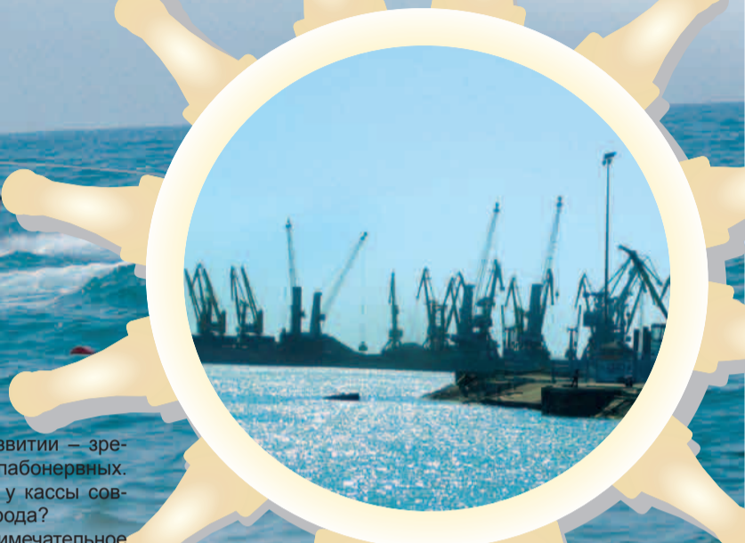
Здесь не только отдыхают, но и работают

Улицы Туапсе вымощены тротуарной плиткой, однако до ухоженности и чистоты Белгорода ему далеко. Возможно, в этом виноваты все те же туристы. Впечатление портит и множество старых домов, часто обветшалых.