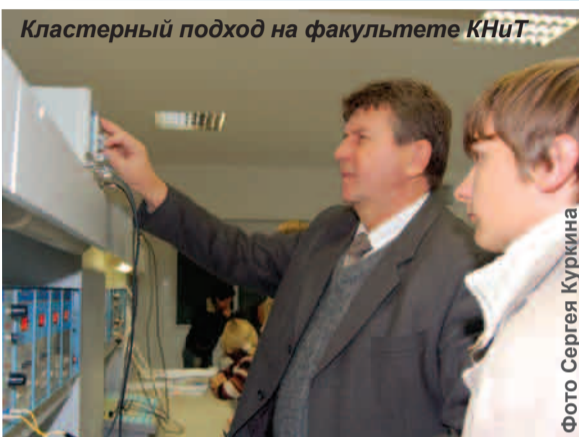
Кластерный подход на факультете КНиТ

– Уже сказалась – поскольку магистерские программы, разрабатываемые университетом в рамках ИОП, являются междисциплинарными. В частности, программы по биосовместимым материалам и электронной микроскопии вызывают интерес у наших зарубежных коллег, которые готовы присылать на стажировку в БелГУ