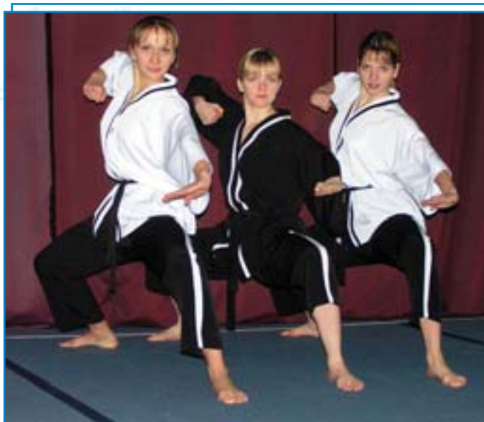
Чемпионки мира - грациозны и воинственны