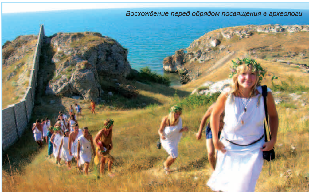
Восхождение перед обрядом посвящения в археологи

В ноябре студенты, магистранты, аспиранты и преподаватели исторического факультета БелГУ подвели итоги археологической практики 2007 года. Экспедиционных направлений в минувшем сезоне оказалось немало.