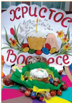
Угощение для гостей нашего праздника