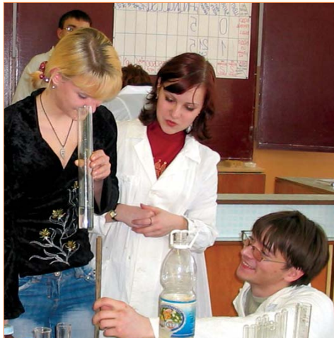
За пару часов ребята могут составить экологическую характеристику микрорайона города