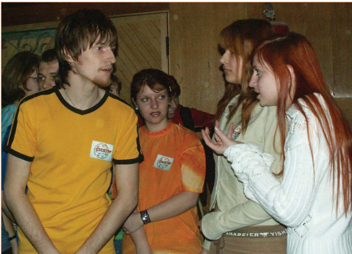
В каждой шутке есть доля правды, а в споре рождается истина