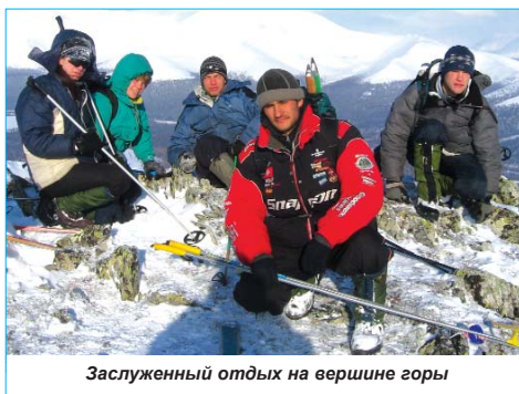
Заслуженный отдых на вершине горы

С середины марта до апреля зима в этом регионе в самом разгаре. Экспедиции пришлось столкнуться со всеми возможными природными стихиями. Сначала мы попали в сильную пургу. Даже такая мощная машина, как "Урал", не смогла пробиться через снежные заносы. Видимость нулевая. Ледяной ветер со снегом буквально разрывал нас на части. Водителям пришлось повернуть назад.