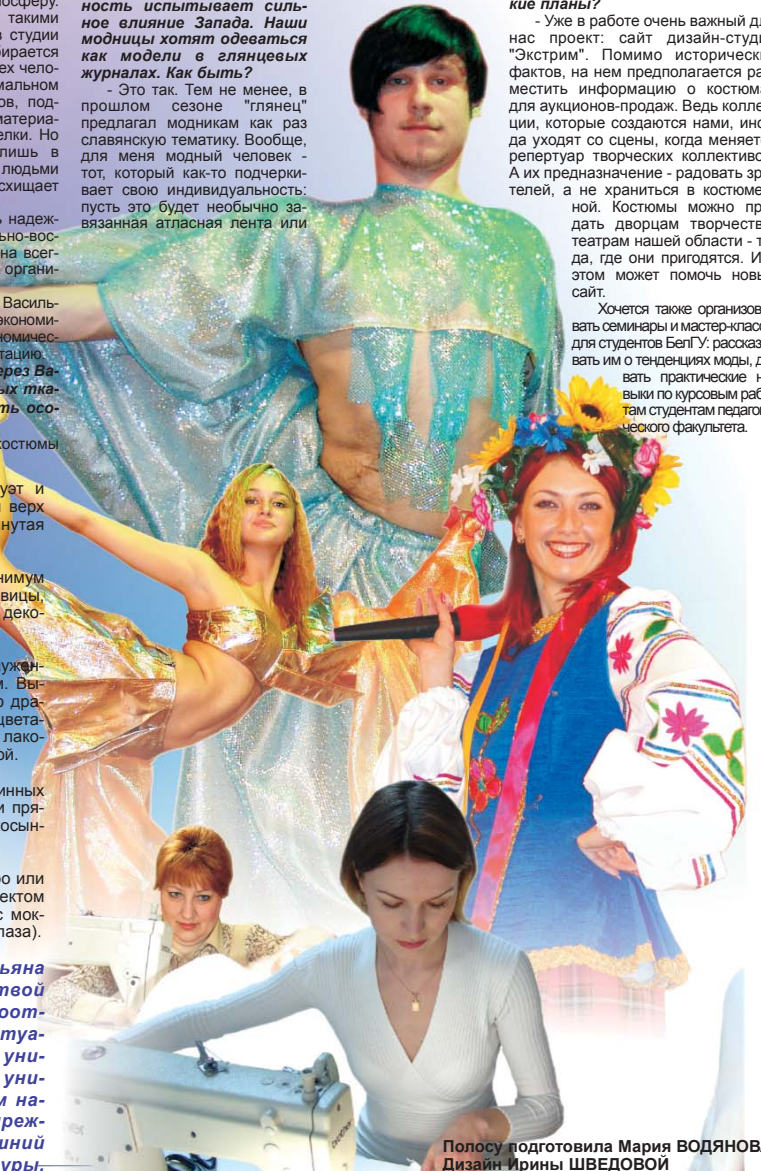
Полосу подготовила Мария ВОДЯНОВА. Дизайн Ирины ШВЕДОВОЙ