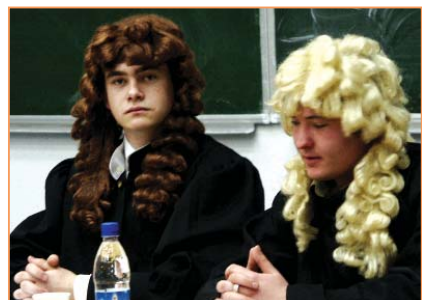
Современные судьи террор не оправдывают

студентами исторического факультета было опубликовано 62 работы.