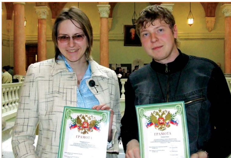
Оригинальность и глубина выступлений представителей факультета журналистики БелГУ оставили приятное впечатление у московских коллег