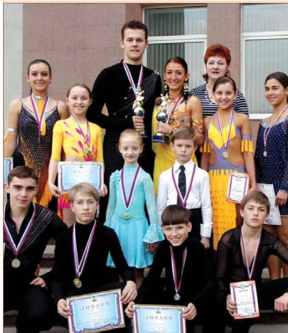
Победители российского турнира / открытого чемпионата БелГУ по спортивным бальным танцам

В среднем 1100 часов в год тренируются пары, неотъемлемой частью жизни которых стали танго, венский вальс, ча-ча-ча, самба и другие танцы. Результаты своей работы они демонстрируют на таких престижных соревнованиях, как, например, российский турнир / открытого чемпионата БелГУ по спортивным танцам. Для танцоров это привычное событие, а для нашего вуза - дебют. 16 апреля мы впервые выступили организаторами подобного состязания в честь 130-летия Белгородского государственного университета. И отныне этот чемпионат станет ещё одной прекрасной традицией.