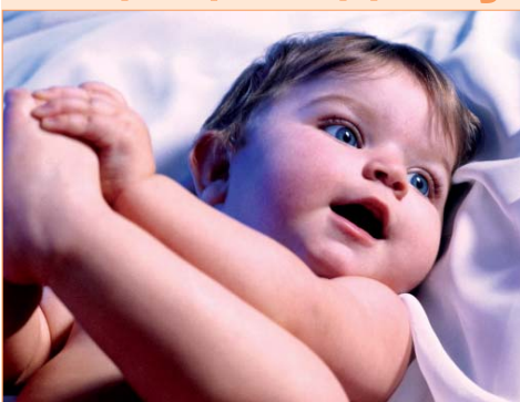
Мамочка, я очень тебя люблю!

В рамках Недели науки на социально-теологическом факультете прошла конференция на тему "Проблемы биоэтики в современном мире". К вышеуказанным проблемам относятся животрепещущие вопросы современности, в частности, аборты, клонирование, генная инженерия и т.д. Эта тема была освещена с двух сторон, не исключая друг друга: с точки зрения Православия, которое предполагает свободу выбора, самоопределения, и медицины, созданной для того, чтобы дарить жизнь, облегчать ее, а не лишать этого Божьего дара.