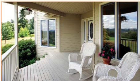
Мечта о своем доме вполне реальна