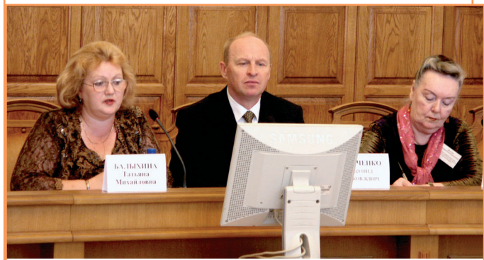
Идёт конференция по русистике

Некоторые из уважаемых гостей, приехавших на юбилей, любезно согласились поделиться своими впечатлениями о БелГУ с нашими читателями.