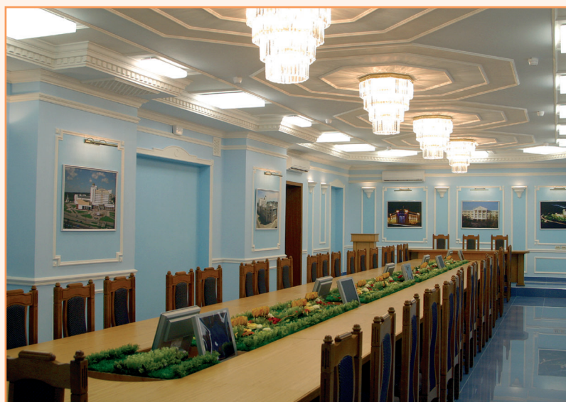
Зал заседаний диссертационного совета