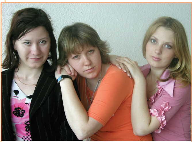
Подружки. Фото на память