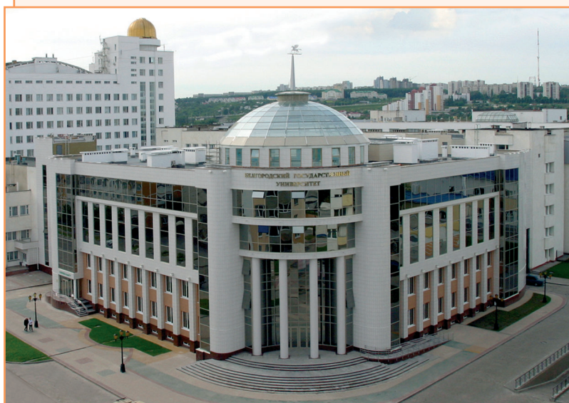
Самый новый и самый красивый...