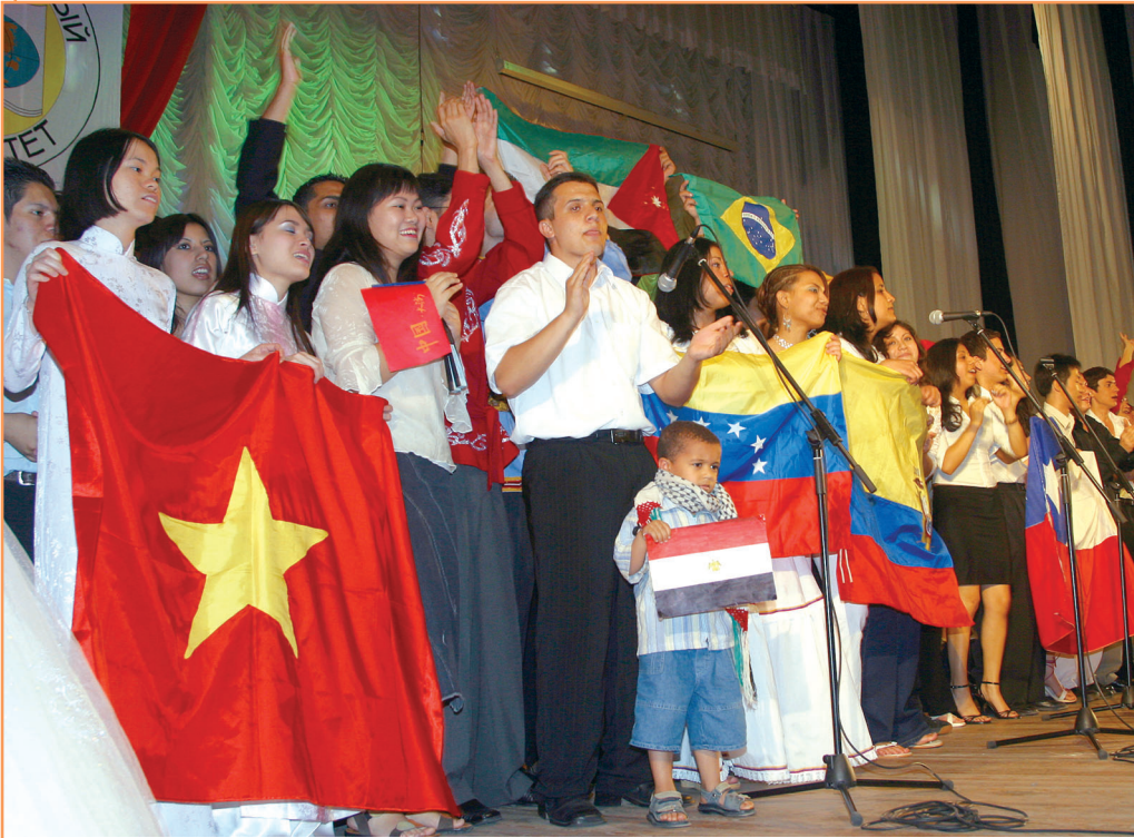
Праздник кончается, дружба - никогда!