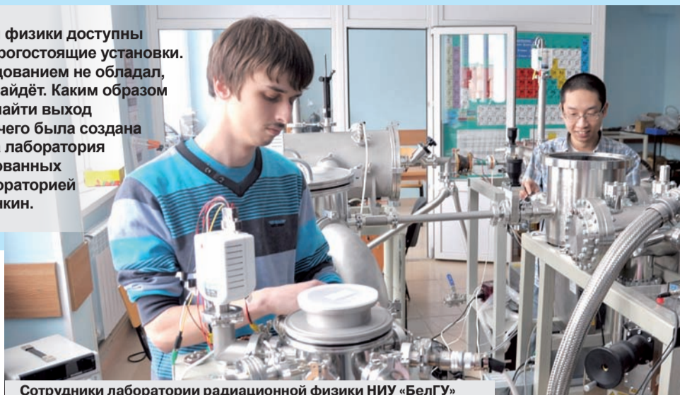
Сотрудники лаборатории радиационной физики НИУ «БелГУ»

Проблемы подготовки специалистов данного профиля удалось удачно разрешить благодаря многолетним связям лаборатории радиационной физики НИУ «БелГУ» с ведущим институтом РАН – Физическим институтом им. П.Н. Лебедева РАН (ФИАН). Сотрудничество началось в начале 2000-х годов в работах по исследованию процессов поляризованного тормозного излучения релятивистских электронов в поликристаллических веществах. Теорию этих процессов развивал зав. кафедрой теоретической физики, а затем и зав. лабораторией радиационной фи-