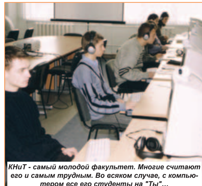
КНиТ - самый молодой факультет. Многие считают его и самым трудным. Во всяком случае, с компьютером все его студенты на "Ты"...

связи являются технологические системы, технические средства, обеспечивающие всякую передачу, излучение и прием знаков, сигналов, письменного текста, изображений, звуков по проводной, радио, оптической или следующей другим системам: сети связи и системы коммутации; многоканальные телекоммуникационные системы, включая системы оптического диапазона; системы и устройства радиосвязи, включая системы спутниковой и мобильной связи; системы и устройства звукового и телевизионного вещания, электроакустики и речевой информатики, мультимедийной техники; системы и устройства передачи данных; средства защиты информации в телекоммуникационных системах; средства метрологического обеспечения телекоммуникационных систем и сетей; управление эксплуатационным и сервисным обслуживанием телекоммуникационных устройств; менеджмент и маркетинг в телекоммуникациях.