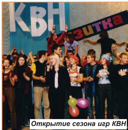
Открытие сезона игр КВН