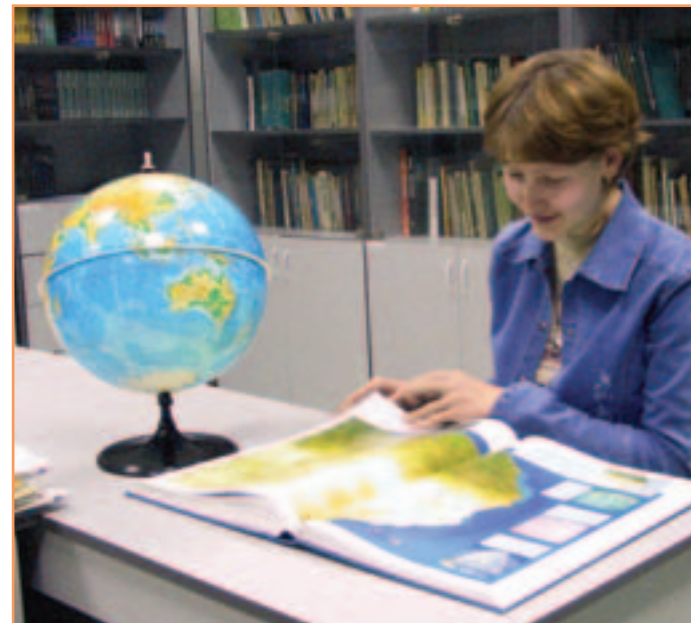
Нас манят города и страны, и недра земных несметные богатства.

По окончании университета молодые специалисты геолого-географического факультета успешно работают в различных отраслях хозяйства Белгородской области (в экологической инспекции, земельном комитете, лесном хозяйстве, в туристических агентствах, геологических организациях и т.д.) и в образовательной сфере. Отличившиеся в научной работе студенты поступают в аспирантуру по специальности "Геоэкология".