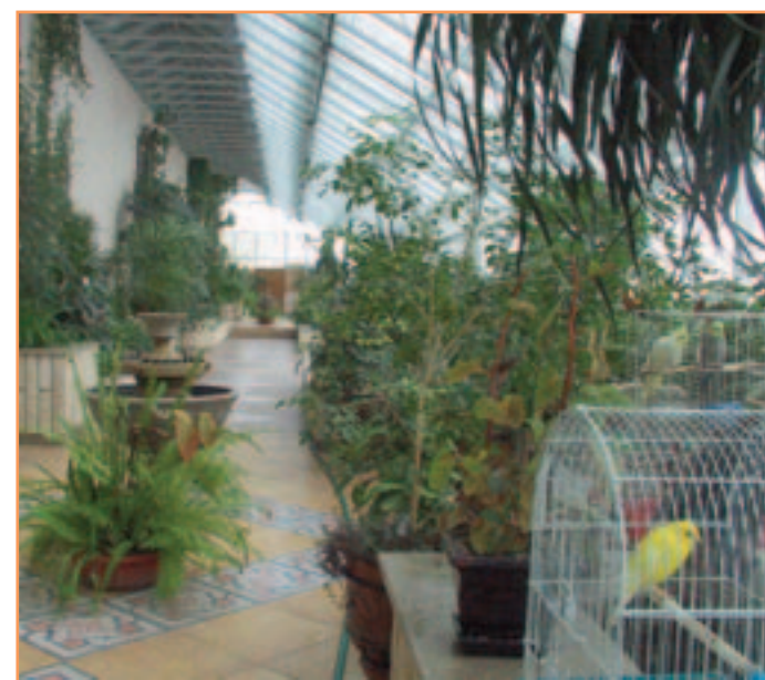
Зимний сад - один из прекраснейших уголков БелГУ. На улице снег, а здесь диковинные цветы, пальмы, кактусы, живые игуаны и тропические птицы.