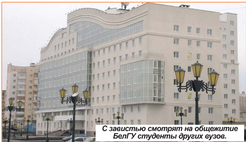
С завистью смотрят на общежитие БелГУ студенты других вузов.

Апелляция по процедуре и результатам вступительных экзаменов в форме и по материалам ЕГЭ рассматриваются в конфликтной комиссии субъекта Федерации.