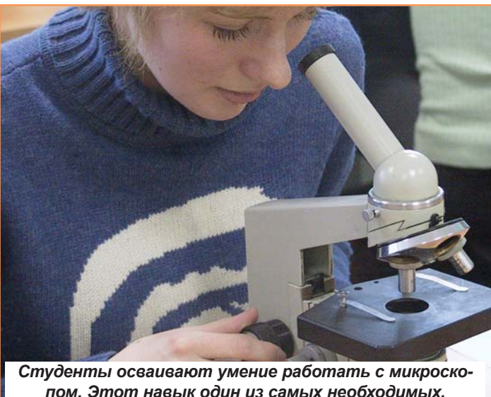
Студенты осваивают умение работать с микроскопом. Этот навык один из самых необходимых.