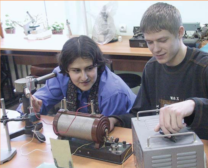
Физик должен иметь не только светлую голову, но и золотые руки. Умение обращаться с приборами, умение поставить опыт - первая ступенька к успеху в этой сложной профессии.

Первые три специальности - педагогические, две другие являются "классическими" специальностями, и обучение по ним проходит по учебным планам, разработанным на основе планов МГУ им. М. В. Ломоносова. Выпускники всех специальностей могут продолжать обучение в аспирантуре БелГУ.