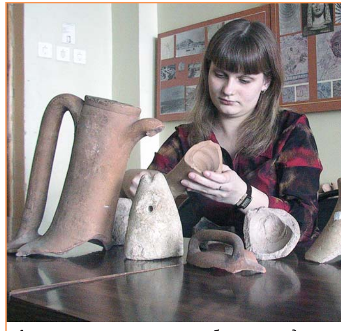
Археологическую практику любят все студенты истфака. Еще бы! Ведь в умелых руках найденные черепки превращаются в прекрасные амфоры...