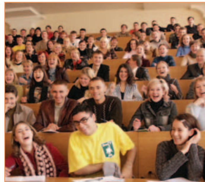
Веселая минутка может найтись и во время лекции. Посмеялись, отдохнули? Теперь вернемся к нашим конспектам.

Выпускные экзамены проводятся в соответствии с требованиями, предъявляемыми на вступительных экзаменах в БелГУ, по дисциплинам вступительных экзаменов. Слушателей, сдавших выпускные экзамены на "4" и "5", приемная комиссия университета рекомендует к зачислению на первый курс. Остальные абитуриенты при получении хотя бы одной тройки приказом ректора считаются окончившими факультет или отчисляются с факультета (получили "2" или не явились на выпускные экзамены). Первые могут в дальнейшем участвовать в общем конкурсе абитуриентов (оценки выпускных экзаменов на ПО засчитываются как оценки вступительных) или пересдавать любые предметы. Вторые - сдавать все экзамены на общих основаниях.