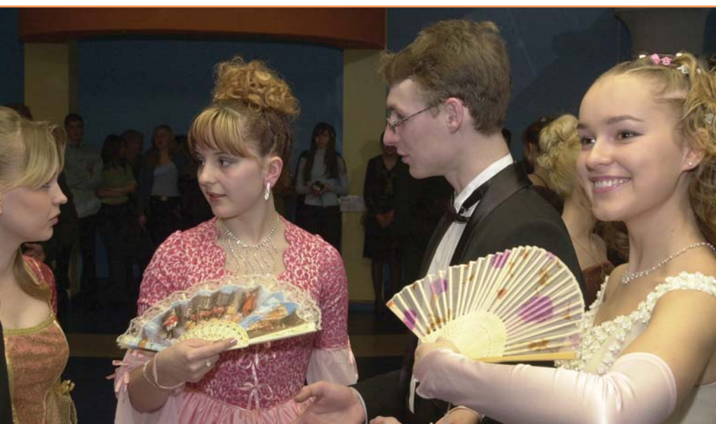
Прекрасная традиция появилась в БелГУ - университетские балы. Разве на дискотеке почувствуешь себя прекрасной дамой? Бал - это всегда праздник...

Профессорско-преподавательский состав двух кафедр факультета составляет 20 человек, в том числе 4 доктора наук, профессора, 7 кандидатов наук, доцентов.