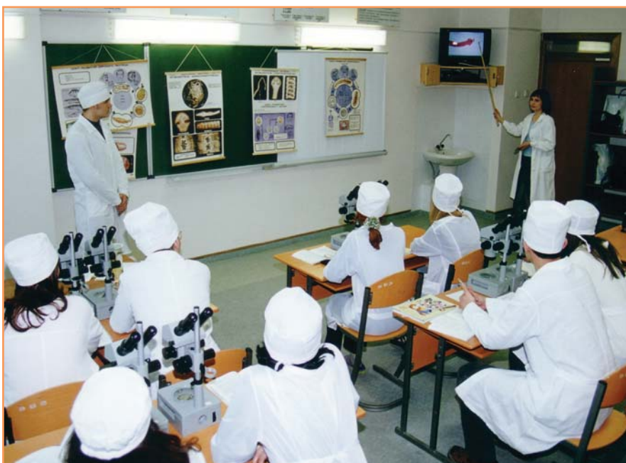
Чтобы стать настоящим врачом, нужно очень многое. Ежедневные серьезные занятия - первый шаг к профессии.