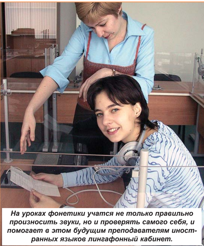
На уроках фонетики учатся не только правильно произносить звуки, но и проверять самого себя, и помогает в этом будущим преподавателям иностранных языков лингафонный кабинет.