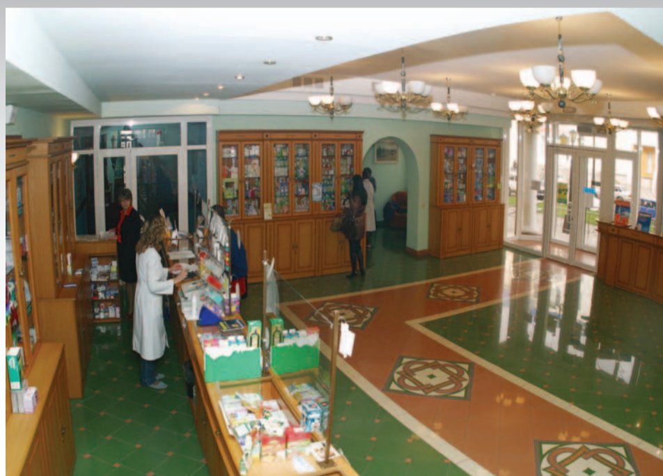
Аптека БелГУ - прекрасная учебно-производственная база для студентов-фармацевтов

В настоящее время обучение ведется на дневном и заочном отделениях на бюджетной и договорной основах. Осуществляется прием иностранных студентов.