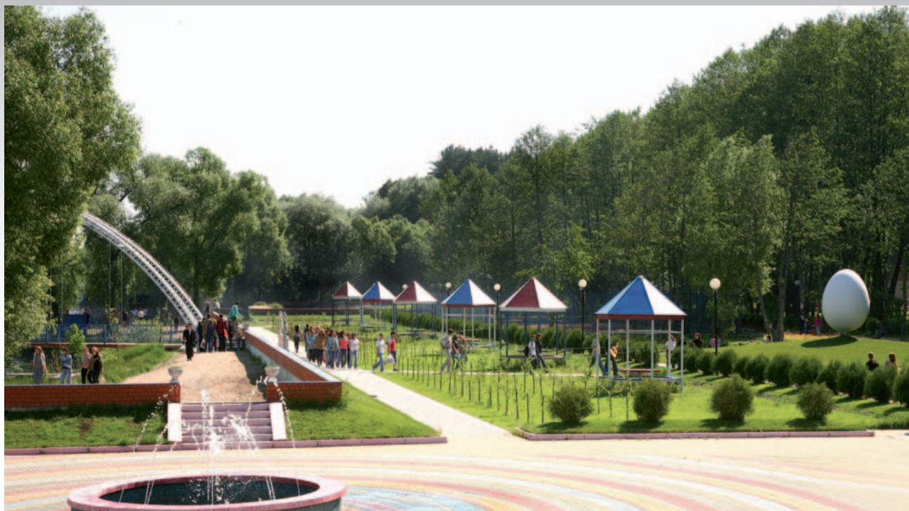
Настоящий студент и работает, и отдыхает со вкусом. В том числе и в природном парке БелГУ «Нежеголь», где воздух так чист и свеж!

Виды профессиональной деятельности: научно-исследовательская, экспериментальная, теоретическая и расчетная. Сфера профессиональной деятельности – высшие учебные заведения, научно-исследовательские институты, лаборатории, конструкторские и проектные бюро и фирмы, производственные объединения и предприятия, учреждения системы высшего и среднего специального образования и лечебно-диагностические учреждения, клиники и госпитали, имеющие сложное современное наукоемкое оборудование.