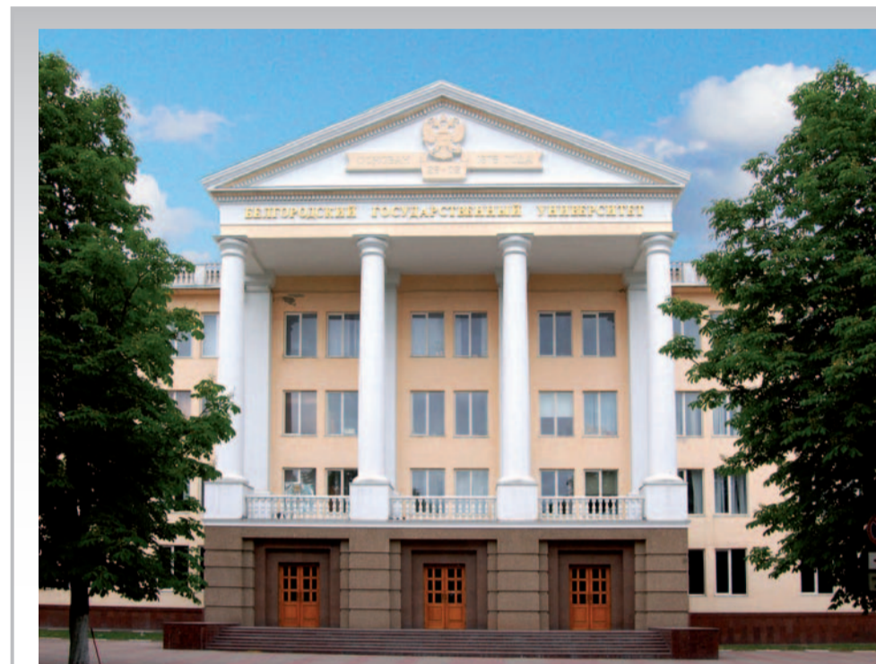
Первый корпус БелГУ по ул. Студенческой украшен классической колоннадой

Область профессиональной деятельности: экспертные подразделения правоохранительных органов,