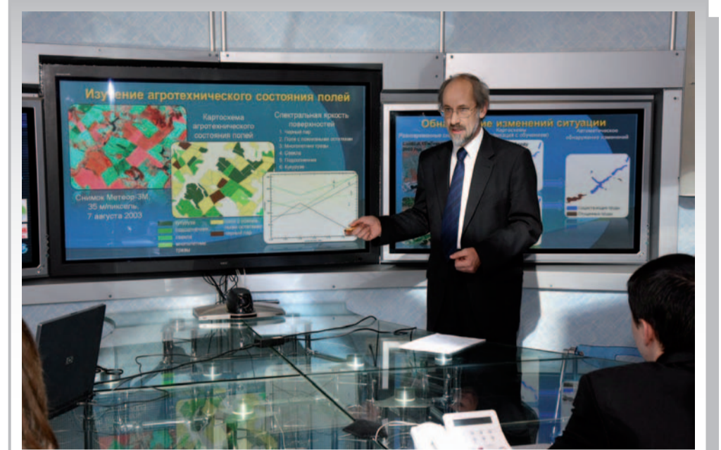
Студенты учатся на самом современном оборудовании

Более 60% выпускников работают в школах и органах образования. Многие выпускники работают директорами и завучами школ, в научно-исследовательских и природоохранительных организациях, повышают квалификацию через магистратуру и аспирантуру.