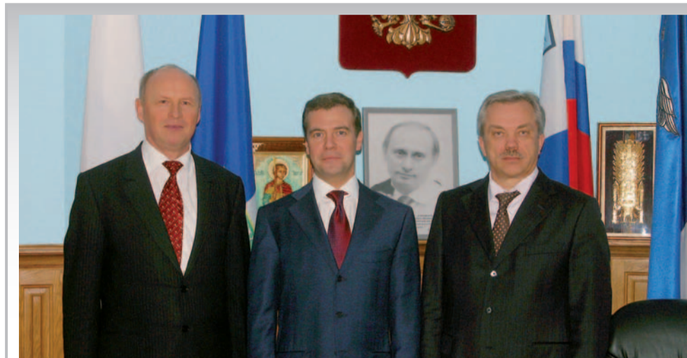
Дмитрий Медведев - почётный гость БелГУ

На заочном отделении факультет готовит учителей биологии, которые приобретают еще и специализацию: «Фитодизайн», «Экология человека» или «Биологический мониторинг». Будущие охотоведы также могут получить образование заочно. Срок обучения на заочном отделении – 6 лет. На заочное и очно-заочное отделение можно поступить как на бюджетной, так и на договорной основе.