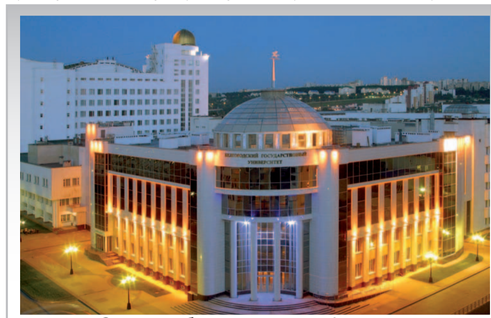
Здесь учатся будущие журналисты, фармацевты, студенты международного факультета

Специальность 260501 «Технология продуктов общественного питания». Область профессиональной деятельности выпускника: предприятия и НИИ общественного и специализированного питания; отрасли пищевой промышленности; перерабатывающие отрасли