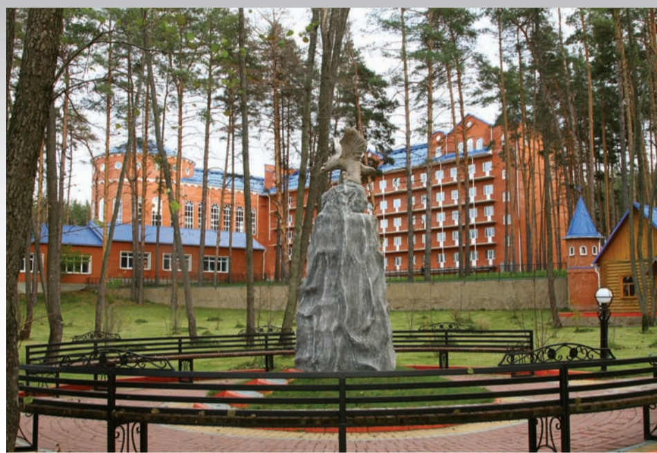
Зачем ехать на море, если рядом Титовка? Это лечебно-профилактический комплекс, теннисные корты, туристические домики, пляж, очаровательные природные уголки

Факультет активно развивает международные связи: на протяжении многих лет мы сотрудничаем с ведущими вузами Украины, Беларуси,