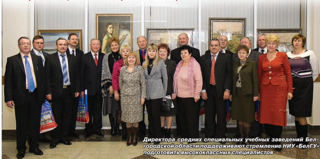
Директора средних специальных учебных заведений Белгородской области поддерживают стремление НИУ «БелГУ» подготовить высококлассных специалистов

за прошлый год мы вложили в развитие науки свыше одного миллиарда рублей – а это в несколько раз больше совокупного объема вложений всех вузов области. При этом кластерный подход, который мы применяем, позволяет получать специалиста высокой компетенции. Если речь идет о лабораторной работе, то в вашем распоряжении будет самый мощный микроскоп и все необходимые химические реактивы. А для приобретения практических навыков вам дадут конкретную проблему из жизни, а не смоделированную ситуацию. Сегодняшний работодатель знает наши принципы обучения, и выпускник НИУ «БелГУ» востребован на рынке труда.