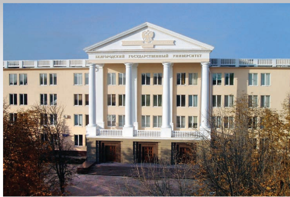
Первый корпус БелГУ по ул. Студенческой украшен классической колоннадой

В рамках Национального исследовательского университета наши преподаватели, аспиранты и студенты активно занимаются наукой, вышли на лидирующие позиции по финансируемым научным проектам, грантам.