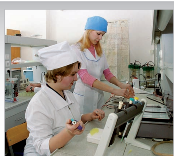
Медицинский факультет: в интерьере лаборатории

формирование устойчивой системы правовых ценностей, где юридическая процедура обеспечения прав и свобод человека и гражданина займет достойное место в системе юридических гарантий. Если вы хотите реально участвовать в этом процессе, получить качественное юридическое образование и совершить завидный карьерный взлет – ждем вас на юридическом факультете!