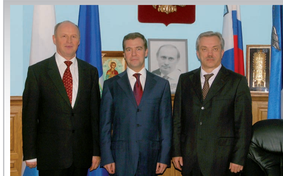
Дмитрий Медведев – почетный гость БелГУ

Многие студенты факультета защищают честь Белгородчины на международных и всероссийских соревнованиях.