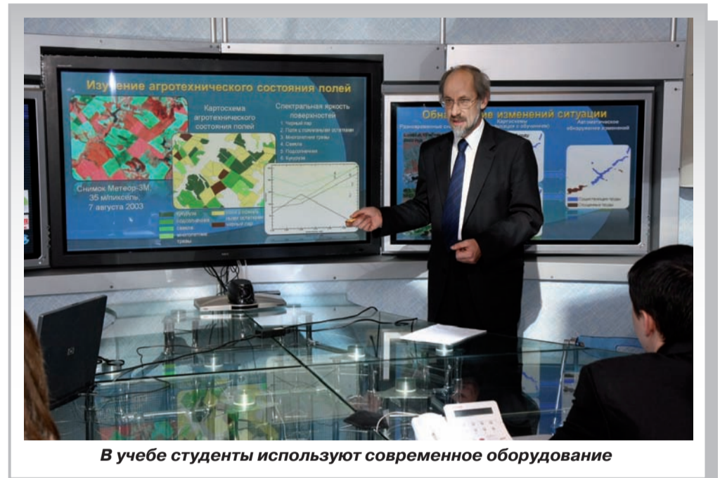
В учебе студенты используют современное оборудование

Выпускники ГГФ успешно трудоустроиваются на производстве. В сфере образования и науки ведут преподавательскую работу: в школах, в вузах, работают директорами и завучами школ, в научно-исследовательских и природоохранительных и горнодобывающих организациях, повышают квалификацию через магистратуру и аспирантуру.