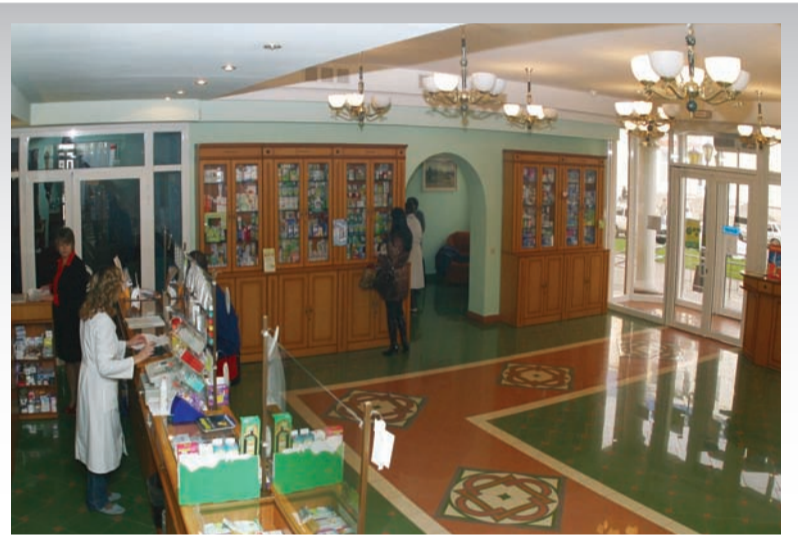
Аптека БелГУ – прекрасная учебно-производственная база для студентов-фармацевтов

По окончании обучения на факультете специалисты могут работать в сфере фармацевтической деятельности в аптеках, фармацевтических организациях, на химико-фармацевтических производствах и т. д., занимая должности высшего управленческого и производственного персонала: заведующий аптекой, провизор-технолог по изготовлению лекарственных