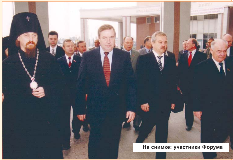
На снимке: участники Форума