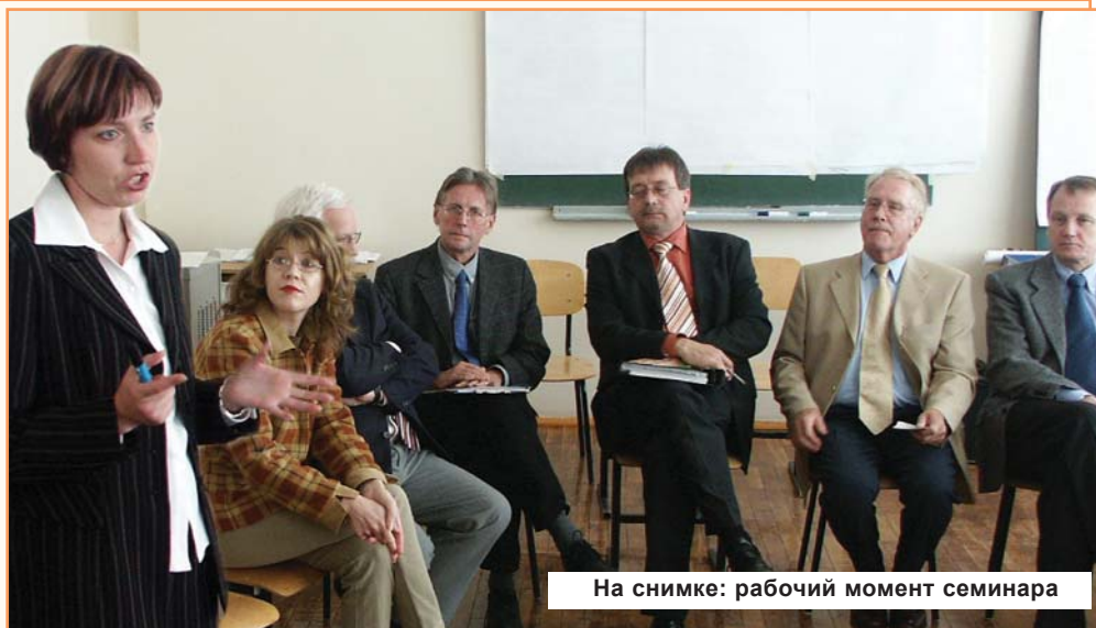
На снимке: рабочий момент семинара

Цель - изучение и отработка стратегии разрешения конфликтов и рефлексии собственного опыта управления конфликтами.