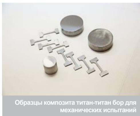
Образцы композита титан-титан бор для механических испытаний