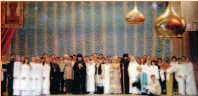
На премьере спектакля в Старом Осколе