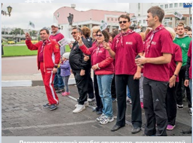
Легкоатлетический пробег студентов, преподавателей, сотрудников в честь 140-летия университета