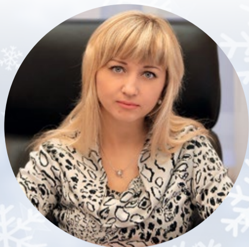
О.А. ПАВЛОВА, заместитель губернатора области

Уважаемые друзья! 2016-й год был наполнен значительным количеством важных и ярких событий. В календаре памятных и праздничных дат Белгородчины особое место заняло 140-летие Белгородского государственного университета.