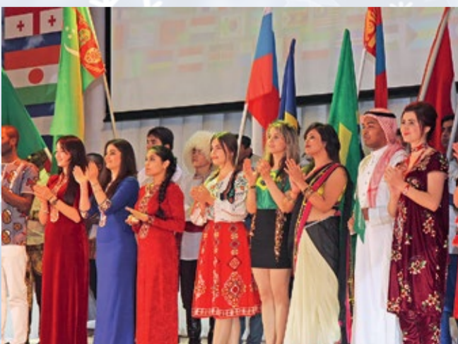
Кульминация концерта «Все флаги в гости к нам»