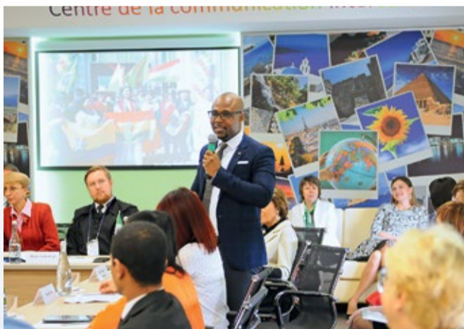
На открытии Центра межкультурной коммуникации