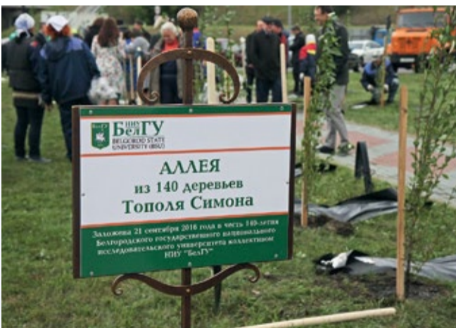
Аллея тополей заложена 21 сентября 2016 года

В 2016 году НИУ «БелГУ» занял 17-е место по параметру «Интернационализация» в Национальном рейтинге университетов, проводимом Международной информационной группой «Интерфакс». Это является прекрасным результатом. Поздравляю всех нас с этим достижением! В 2017 году нас ждут встречи с новыми международными партнёрами, расширение академического и научно-технического сотрудничества и многосторонний культурный обмен. Давайте пожелаем друг другу успехов во всех начинаниях, здоровья, благополучия, любви и радости! ●●