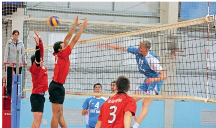
Мужская сборная НИУ «БелГУ» по волейболу